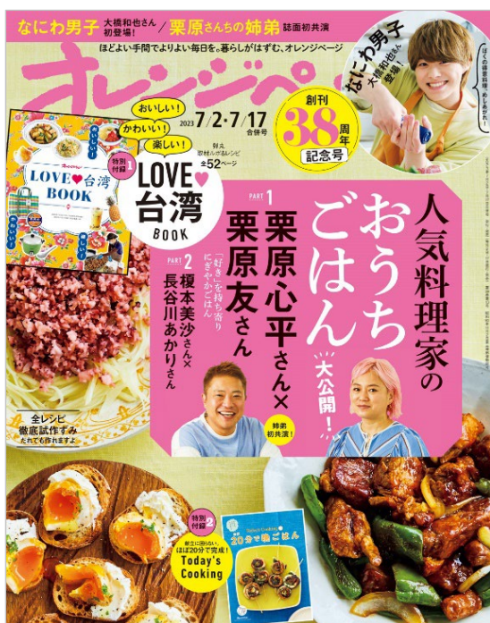
『オレンジページ 7/2・7/17 合併号』

株式会社オレンジページ(東京都港区)が月2回発行する生活情報誌『オレンジページ』は、創刊38周年を迎えます。2023年6月16日(金)発売の記念号では、スペシャル企画が目白押し！なにわ男子の大橋和也さんが誌面初登場で得意料理を披露、人気料理家たちのおうちごはんを大公開、約1200人の読者にきいた繰り返し作る大好きおかずほか、撮り下ろし取材ルポ&レシピも充実の別冊付録「LOVE♡台湾 BOOK」(52ページ)がついて、特別定価690円(税込)です。