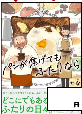
パンが焦げてもふたりなら 978-4-86593-631-5 本体1200円+税/A5