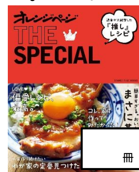
オレンジページ THE SPECIAL 978-4-86593-611-7 本体900円+税/A4変