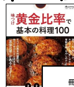
味つけ黄金比率で基本の料理100 978-4-86593-344-4 本体980円+税/AB