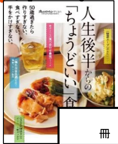
人生後半からの「ちよどいい」食 978-4-86593-612-4 本体1,400円+税/A4変