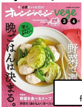
オレンジページ Vege3-4 978-4-86593-623-0 本体700円+税/A4変