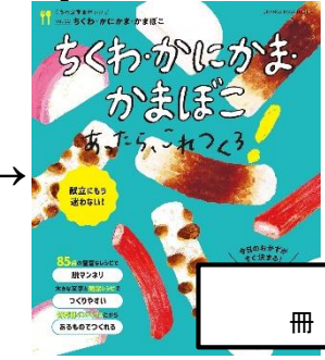
ちくわ・かにかま・かまぼこあつたら、これつくる！ 978-4-86593-627-8 本体600円/AB

「これつくる」シリーズの21、22冊目の新刊！シリーズで並べると迫力のフェアになります♪