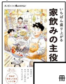
いちばん盛り上がる家飲みの主役メシ 978-4-86593-622-3 本体1,000円+税/A4変