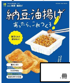
納豆・油揚げあつたら、これつくる！ 978-4-86593-626-1 本体600円/AB