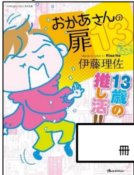
おかあさんの扉13 978-4-86593-621-6 本体900円+税/A5