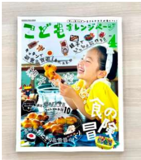
※画像はNo.4のものです

『こどもオレンジページ』に純広告を掲載頂けます。 原稿をお持ちでない場合は、別途料金で作成も可能です。