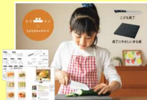
株式会社釜浅商店 様 (オリジナル包丁・まな板の開発)