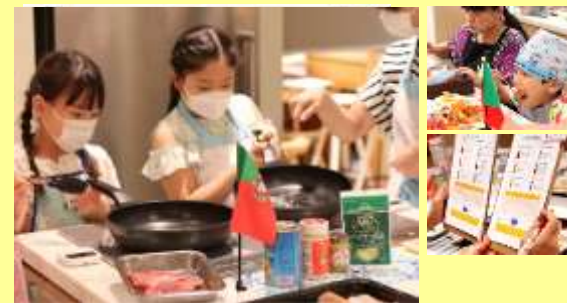
ユウキ食品株式会社 様