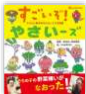
『すごいぞ! やさいーズ』