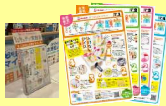
株式会社イトーヨーカ堂 様 (店頭リーフレット制作)