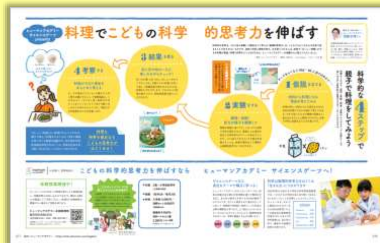
ヒューマンホールディングス株式会社 様

親子でチャレンジしたくなる 楽しいレシピだけでなく 教育、おでかけ、からだなどの 周辺コンテンツも 興味を誘うページを作成します