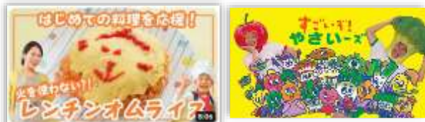
「すごいぞ! やさいーズ」ダンス動画