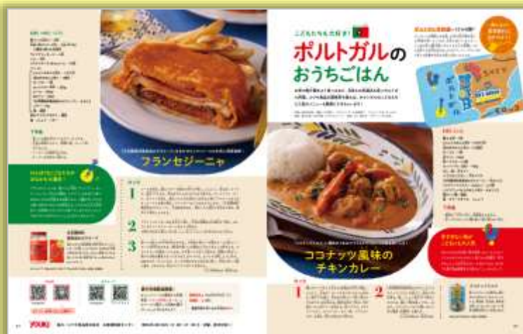
ユウキ食品株式会社 様

親子でチャレンジしたくなる 楽しいレシピだけでなく 教育、おでかけ、からだなどの 周辺コンテンツも 興味を誘うページを作成します