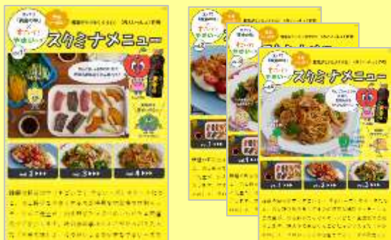
エバラ食品工業株式会社 様