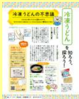
テーブルマーク株式会社 様