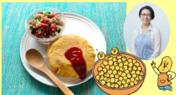
フジッコ株式会社 様