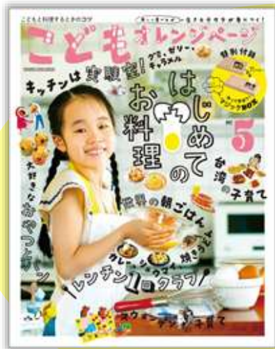
こどもオレンジページ