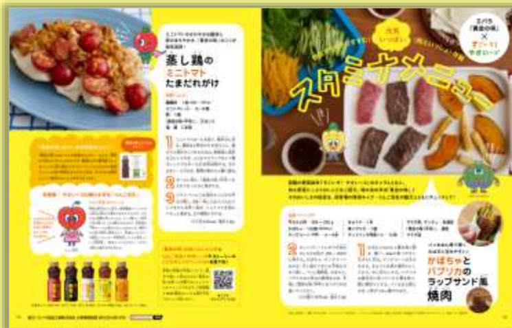
エバラ食品工業株式会社 様