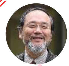
ムック本 『こどもオレンジページ』 総合監修 汐見稔幸先生