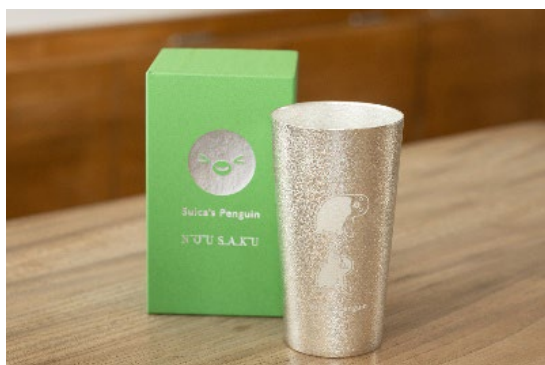
ヨガ:健康維持の願いを込めて