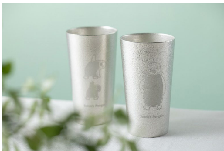
「Suica のペンギン 錫のビアカップ」 左:ヨガ、右:バラ 各11,000円(税込)