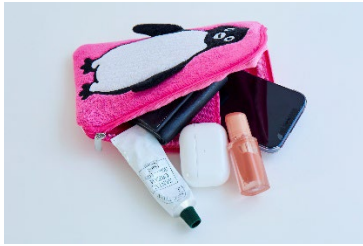
小物を収納するポーチにも！

タオル生地で、思わずなでたくなる肌ざわりのよきのスマホショルダーバッグ。細かいところまで、こだわりが詰まっています。ナスカンごとストラップをはずせば、ポーチ使いも！ たっぷり入るので、コスメやイヤホンなど、ごちゃつきがちな小物をすっきりしまえます。裏側についているクリアポケットは、パスケースやカード類を入れるのにぴったり。ポーチの口はL字ファスナーで大きく開くので出し入れしやすく、内側のポケットは、スマホを入れたり、ペンなどをしまうのにも最適です。