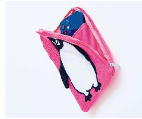
L字ファスナーで開きやすい

■こちらの紹介記事もチェック https://www.orangepage.net/ymsr/news/opnetnews/posts/12534