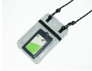
裏側のクリアポケットが使える！