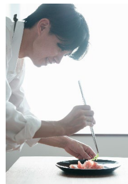
『自分史上、最高にうまい 人生を変える野菜料理』(Shun)