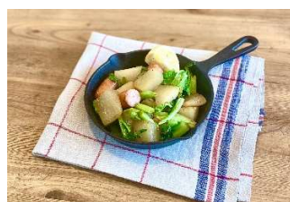
左から、青ネギと牛肉のバジル丼、にんにくと豆のスープ たっぶりのオリーブオイル、大根と白菜のドイツ風ソテー