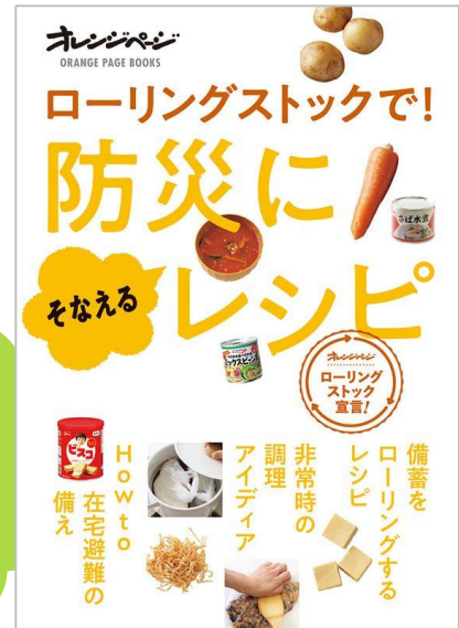
▲防災レシピのムック本