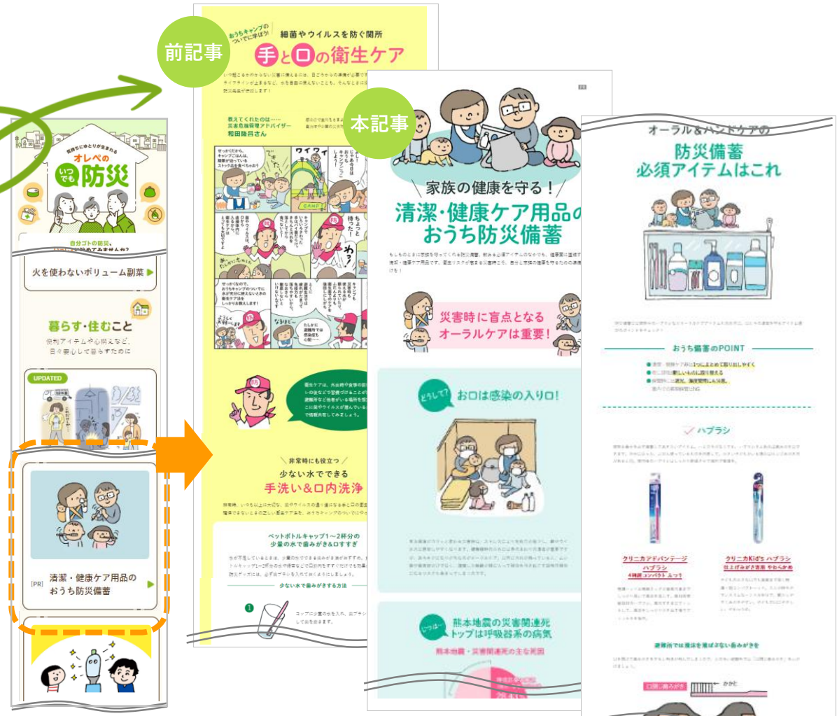
▲オレンジページnet「いつでも防災」TOP