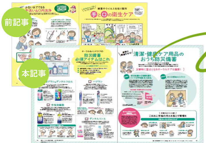
▲『オレンジページ』22年6/2発売号